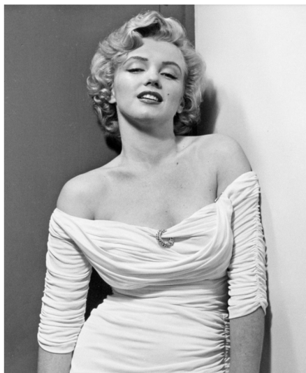
La inolvidable Marilyn Monroe, en una sugestiva pose, 1952.

Vendrán, sin duda, otras investigaciones y conclusiones, más ricas, acertadas y penetrantes; bienvenidas sean porque a ellas recurriremos para ampliar nuestras miradas.