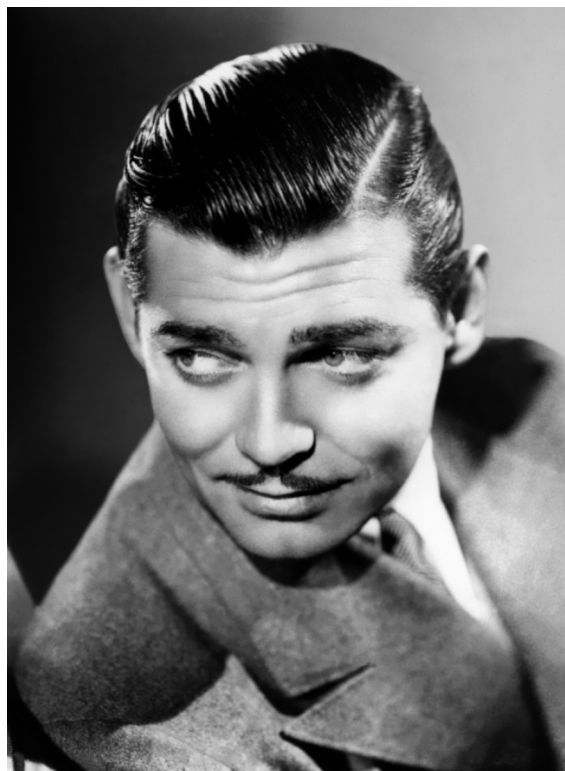
Clark Gable, por más de tres décadas el galán soñado por millones de espectadoras.

Trataremos, al fin, de exponer y explicar estos rasgos.