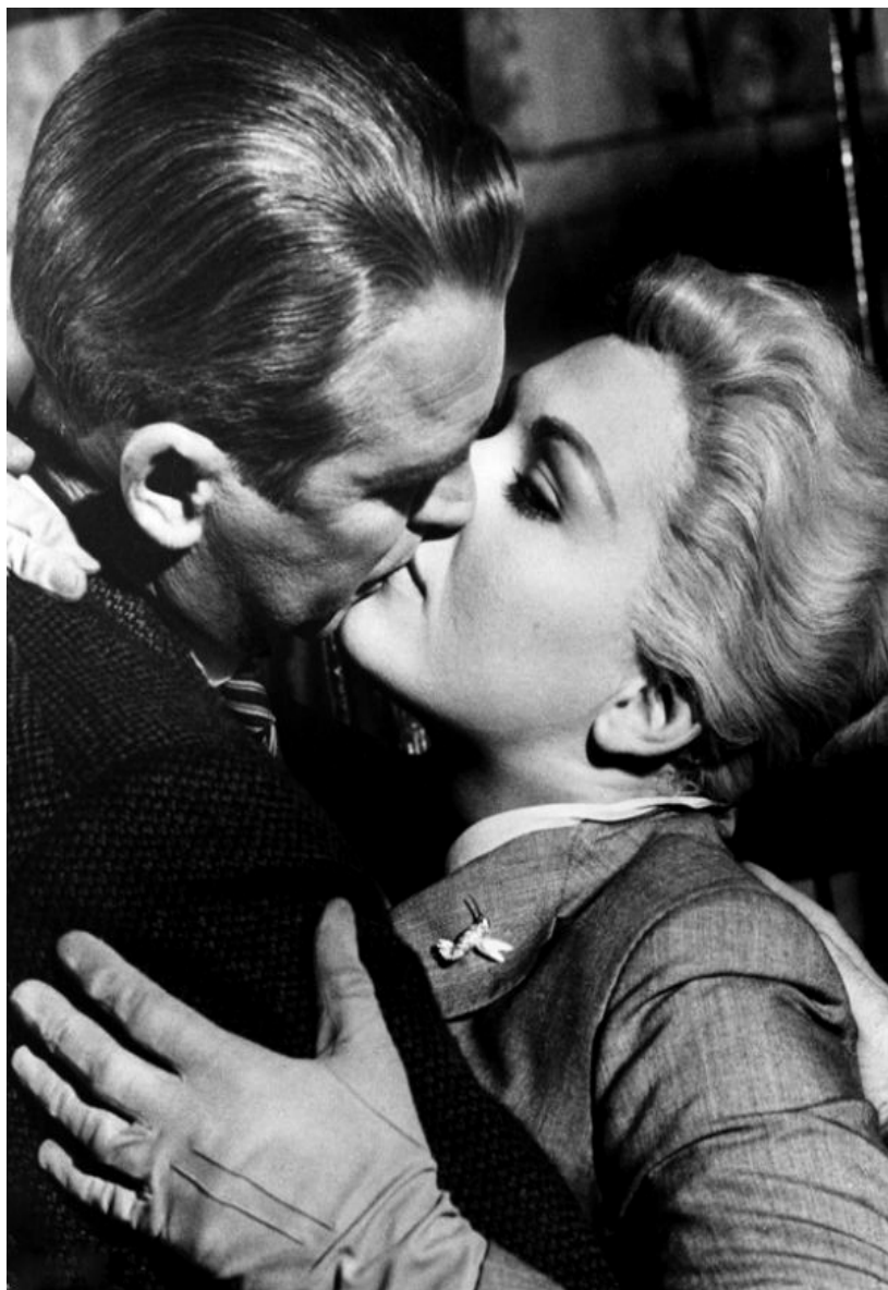
El amor siempre presente. James Stewart y Kim Novak en "Vértigo" (1958), del "mago del suspenso" Alfred Hitchcock.