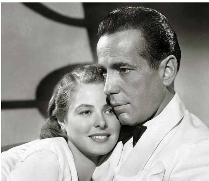
Humphrey Bogart (Rick) e Ingrid Bergman, en "Casablanca" (1942), un clásico del drama amoroso en el cine norteamericano.

Los indígenas, durante toda esa larga etapa quedaron confinados al papel de villanos "cortadores de cabelleras" que dificultaron con sus ataques y acechanzas la llegada de la "civilización" a las primeras praderas del oeste. Sobre los pobres (pero blancos, por supuesto), el cine se permitió un momento de escape con los filmes de aliento social producidos en los años siguientes a la crisis del año 29 ya referidos en el Capítulo II. Tal vez, luego de todo lo expuesto, resulta redundante insistir en que el tratamiento de los grupos étnicos considerados inferiores, y de los pobres, tocaba esferas altamente sensibles e ideologizadas. Acerca de este particular una industria como la de Hollywood -pese a las convicciones que en el plano individual pudieran tener algunos directivos- no podía hacer concesiones, pues uno de sus objetivos, era mostrar una Norteamérica deseable que expresara al mundo las virtudes de su sistema y modo de vida, tal cual eran concebidas por los sectores sociales dominantes.