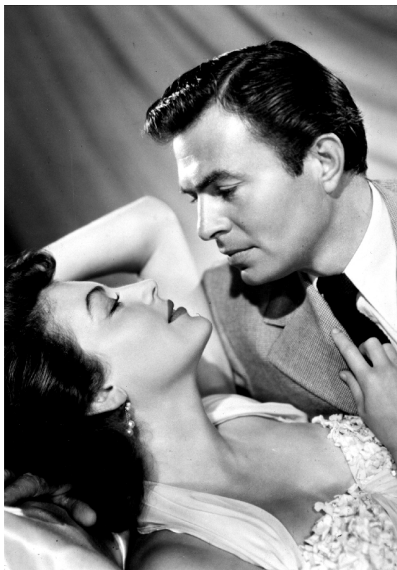
Ava Gardner y James Mason en "Pandora y el holandés errante" (1951) dirigida por Albert Lewin.

Hoy, a varias décadas de distancia de la "Época de Oro", los avances de las comunicaciones nos sitúan en otra dimensión. Los multimedia amenazan con romper para siempre el viejo hechizo y sustituir con otros artificios y manipulaciones, lo que antes fue sólo sueño e imaginación. Rutilantes centros comerciales o feas barracas de depósito, se erigen donde antes estuvieron las más famosas salas de proyección. Pero el alma del cine de aquella época, las historias de amor que una vez fueron interpretadas y las estrellas que les dieron fama, aún viven y están con nosotros. ¡Larga vida a ese espectáculo maravilloso!